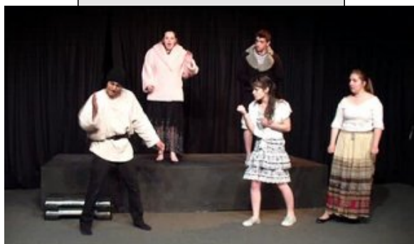
Premières : 2ème séquence