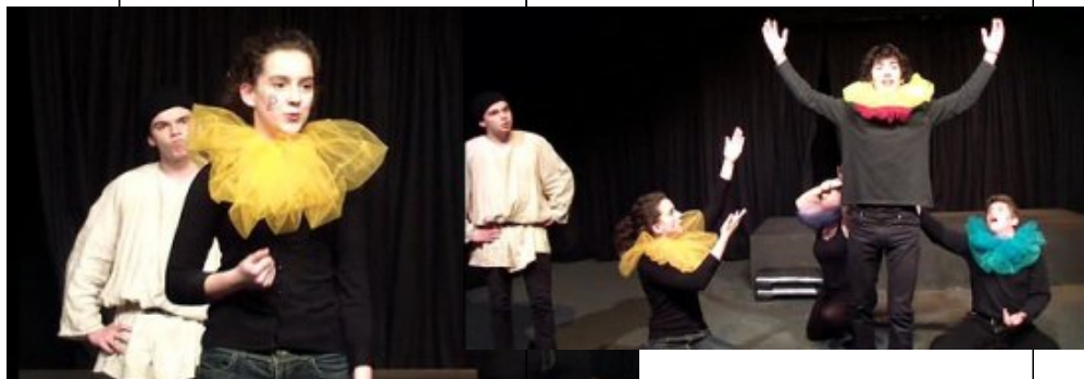
Premières : 1ère séquence